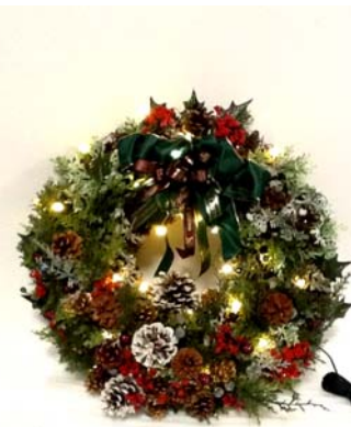
LEDルミキャップを使った クリスマスリース