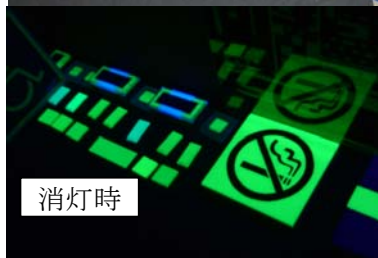
蓄光製品のサンプル